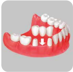
GELENEKSEL KURON VE KÖPRÜ PROTEZİ