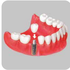
İMLANT DESTEKLİ SABİT PROTEZ

Kliniğimizde; Trias®-ixx2® Implant Systems tercih edilmektedir.